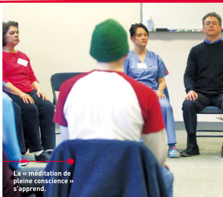
La « méditation de pleine conscience » s'apprend.

Un nombre exponentiel de publications scientifiques témoigne de l'intérêt des neurosciences pour la méditation, en général, et ses implications thérapeutiques, en particulier. Ainsi, l'équipe du psychologue cognitiviste canadien Zindel Segal, du Centre de l'Ontario pour l'addiction et santé mentale, a montré en 2010 qu'une psychothérapie fondée sur la méditation de pleine conscience, un programme baptisé MBCT ( Mindfulness-Based Cognitive Therapy , thérapie cognitive fondée sur la pleine conscience), peut avoir un effet sur la prévention de la rechute de la dépression comparable à celui d'un antidépresseur standard, et supérieur à celui d'un placebo. D'autres expériences attestent de l'efficacité de la méditation sur le contrôle de l'attention. Soumis à une tâche répétitive réclamant une